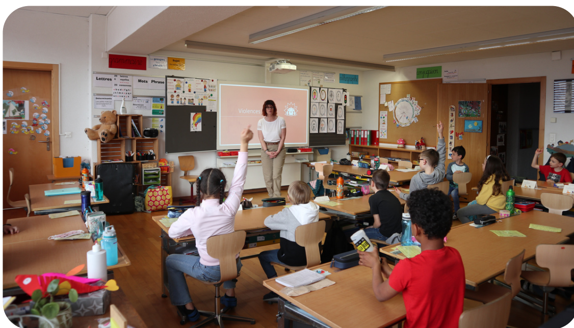
Cours module 1 dans une classe de 4H

Pendant la partie pratique (en salle de gymnastique), les enfants prennent conscience de leur droit de se défendre et de défendre les autres, s'exercent à appeler au secours de manière efficace, identifient les situations qui pourraient être dangereuses, apprennent à éviter les pièges dans lesquels ils pourraient être entraînés, apprennent comment agir s'ils sont ou ont été victimes ou témoins d'une agression et découvrent puis exercent des techniques de défense.