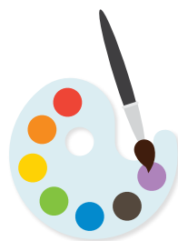
De la peinture ou des feutres