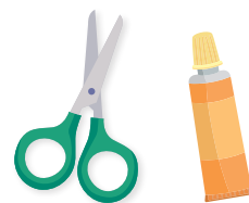
Des ciseaux et un tube de colle