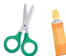
Des ciseaux et un tube de colle

Le principe est que ton maître ou ta maîtresse, tes parents, tes camarades, tes frères et sœurs puissent venir y déposer des messages positifs quand ils le souhaitent. Cela peut être des dessins, des mots d'encouragement, des citations, des mots d'amour.